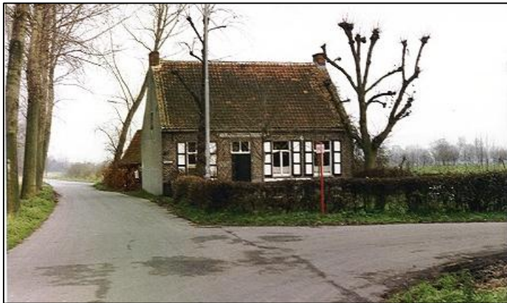
Estaminet In den bouw, foto André De Wilde, ca. 2000.

Het volledige programma, exacte data voor de tentoonstellingen ook die in het voorjaar), liggen nog niet helemaal vast.